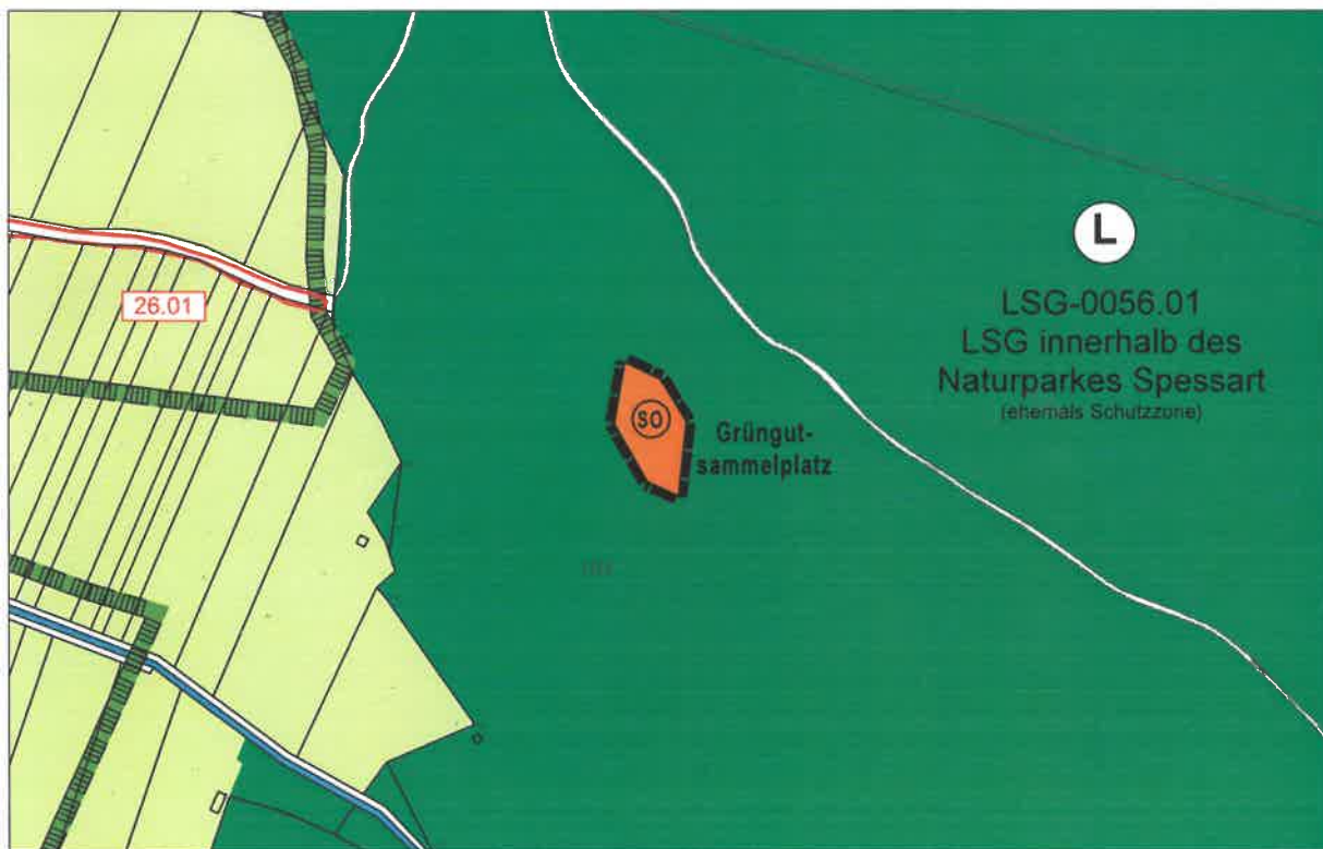
Geänderte Fassung des FNP (Ausschnitt)