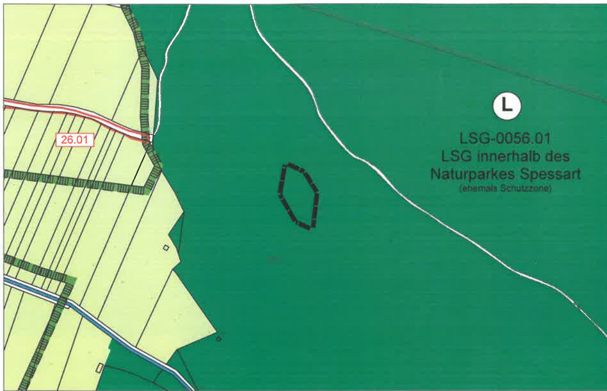
Ausschnitt aus der aktuellen Fassung des FNP Röllbach mit Änderungsbereich